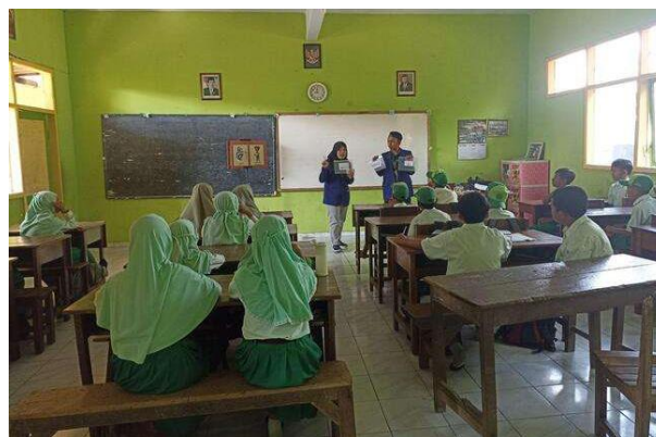
Gambar 6. Pengenalan dompet digital

Berikutnya, tim mulai menjelaskan mengenai asal isi dari dompet digital, sebagaimana pada Gambar 6 . Proses terisinya dompet digital tentunya dikaitkan dengan sumber uang yakni bekerja. Untuk mempermudah pemahaman siswa tim mempraktikkan bagaimana uang dapat masuk di dompet digital yakni dengan cara ditransfer. Kegiatan ini bertujuan agar memberikan pemahaman bahwa sekalipun transaksi dilakukan secara online dimana tidak ada wujud fisik yang terlihat, apabila dilakukan secara berkelanjutan tanpa ada batasan menyebabkan perilaku konsumtif. Pengelolaan uang tidak hanya ditabung saja tetapi juga perlu menekan keinginan untuk berbelanja hal yang dirasa tidak perlu. Siswa diberi pemahaman bahwa uang yang dimiliki tidak hanya untuk belanja saja tetapi juga perlu menyediakan untuk amal atau menabung. Pada akhir kegiatan, tim juga memberikan pembelajaran mengenai cara mengelola uang saku. Tujuan penjelasan tentunya agar siswa dapat menyisihkan sebagian uang saku, yaitu untuk amal dan juga menabung untuk kebutuhan masa depan.