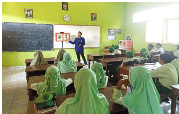
Gambar 3. Edukasi sumber keuangan dengan alat peraga

Upaya mengenalkan sumber uang diawali dengan kegiatan berjudul “siapa aku”, yang memberikan penjelasan ke siswa mengenai beberapa contoh pekerjaan yang dapat menghasilkan uang. Profesi yang dipilih adalah pekerjaan yang ada di sekitar lingkungan siswa, sehingga mereka lebih mudah berimajinasi. Pada Gambar 3, tim mengenalkan profesi sebagai pemadam kebakaran. Seperti yang diketahui oleh siswa bahwa pemadam kebakaran adalah penyelamat orang saat terkena musibah, tetapi hal tersebut juga merupakan sumber pencaharian. Tidak hanya hal tersebut untuk menumbuhkan suasana kelas, 2 siswa diberikan kesempatan untuk maju ke depan dan memeragakan 2 profesi yakni chef dan polisi, sebagaimana tampak pada Gambar 4.