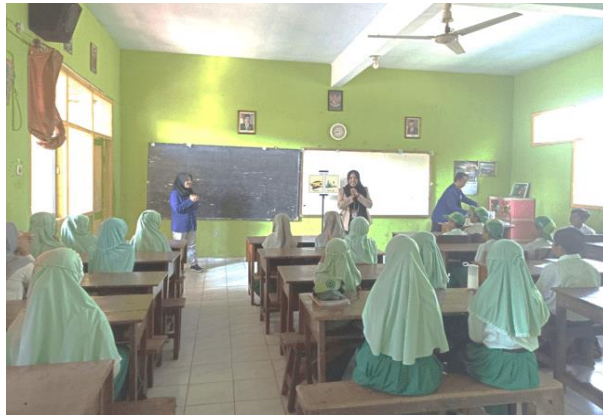
Gambar 2. Kegiatan ice breaking

maka tim memberikan aktivitas “ simon say ”. Bentuk dari aktivitas ini adalah dengan memberikan perintah agar siswa mengikuti apa yang diminta guru (misalnya berdiri, duduk, lompat, memegang kepala, dan sebagainya) akan tetapi guru akan mengecohkan kalimat agar suasana kelas menjadi seru (Ghifarah & Pusparini, 2023). Setelah suasana kelas sudah mulai menyenangkan dan kondusif, tim menyampaikan materi sumber uang. Sebelum menjelaskan bagaimana cara mengelola uang, siswa perlu dipahamkan dari mana uang berasal. Hal ini bertujuan agar siswa menghargai uang yang diperoleh karena ada proses dalam mendapatkannya.