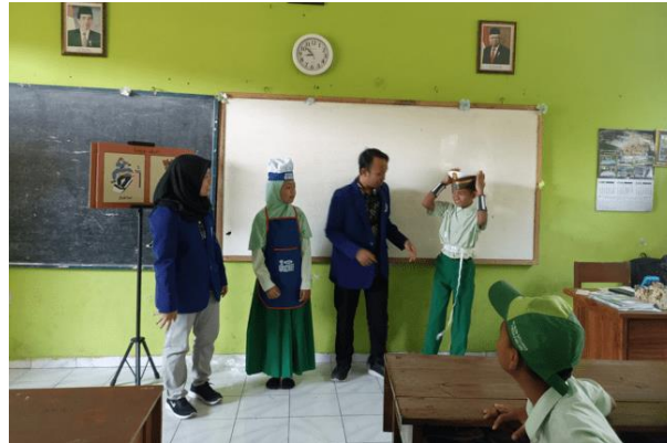
Gambar 4. Siswa memperagakan profesi

tim menjelaskan penggunaan uang, untuk transaksi pembelanjaan, amal dan juga menabung.