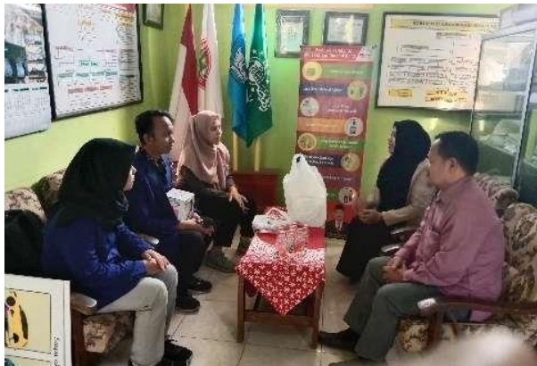
Gambar 1. Koordinasi tim pengabdian bersama kepala sekolah dan dewan guru

kegiatan pengabdian dapat berjalan dengan tertib. Kegiatan akan dilakukan pada siswa kelas 6 SD sejumlah 32 siswa.