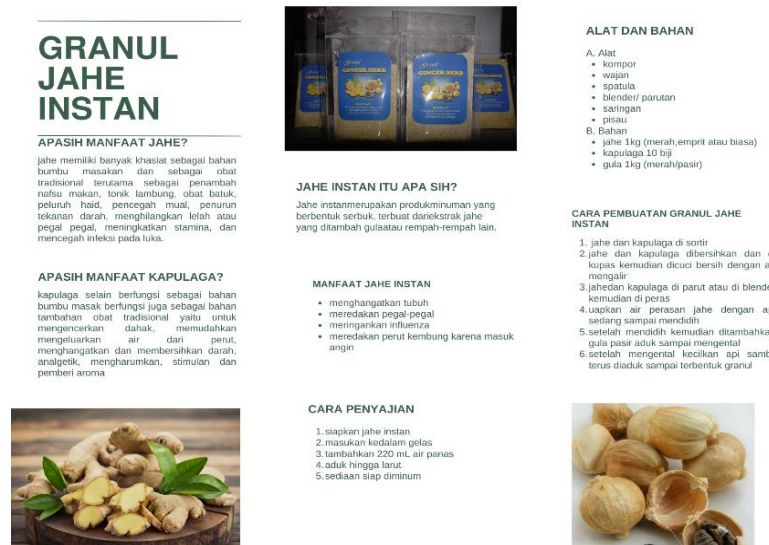
Gambar 8. Brosur pembuatan granul jahe instan

terjadi peningkatan pengetahuan warga terhadap penggunaan TOGA serta pemanfaatannya untuk pengobatan sehari-hari (Gambar 7). Pada kegiatan ini dilakukan pula pembagian brosur pembuatan granul jahe instan (Gambar 8).