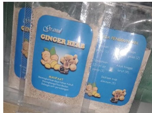
Gambar 6. Produk granul instan