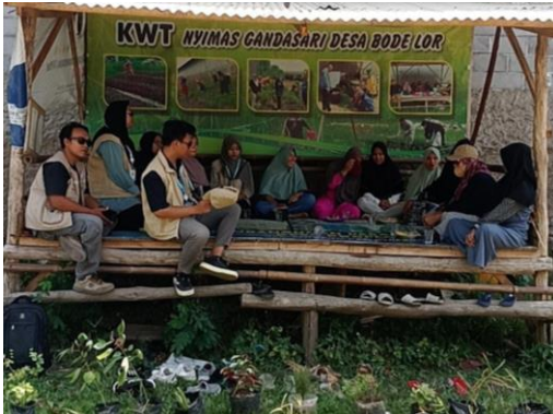
Gambar 1. Pelaksanaan sosialisasi penggunaan TOGA

Sosialisasi penggunaan TOGA dilaksanakan pada hari Jumat, 11 Agustus 2023 bertempat di Saung KWT Desa Bode Lor RT 1 RW 1 dihadiri ibu-ibu KWT berjumlah 10 orang (Gambar 1). Sosialisasi dan penyuluhan tentang TOGA ini dilakukan dengan pemberian materi secara langsung tentang TOGA yang sebelumnya dilakukan juga pre-test untuk mengetahui seberapa dalam pengetahuan warga terhadap penggunaan TOGA di Masyarakat (Gambar 2). Diharapkan Tanaman Obat Keluarga (TOGA) dapat berkembang dan dijadikan apotek hidup bagi Desa Bode Lor. Hambatan dari kegiatan penanaman TOGA ini yaitu tanaman obat tidak bisa langsung di tanam di lahan, karena lahan milik KWT sudah habis masa kontrak sedangkan lahan yang baru masih dalam proses perbaikan.