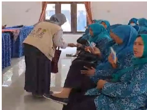
Gambar 7. Sosialisasi pembuatan granul jahe instan dan post-test

Kegiatan sosialisasi dilaksanakan pada hari Rabu, 23 Agustus 2023 pada pukul 09.00 WIB sampai selesai. Sosialisasi ini diikuti oleh sebagian besar ibu-ibu PKK. PKK merupakan target pengabdian pembuatan granul instan jahe emprit ini karena dapat dijadikan sebagai salah satu jenis usaha oleh ibu-ibu PKK dalam program UP2K-PKK. Selain itu dilakukan juga sesi tanya jawab dengan post-test pemahaman materi secara lisan, hal ini dilakukan untuk mengetahui sejauh mana peserta dapat memahami materi yang telah disampaikan. Dari hasil post-test semua pertanyaan dapat dijawab dengan baik oleh peserta. Artinya, penyampaian materi dapat diterima baik oleh peserta, sehingga