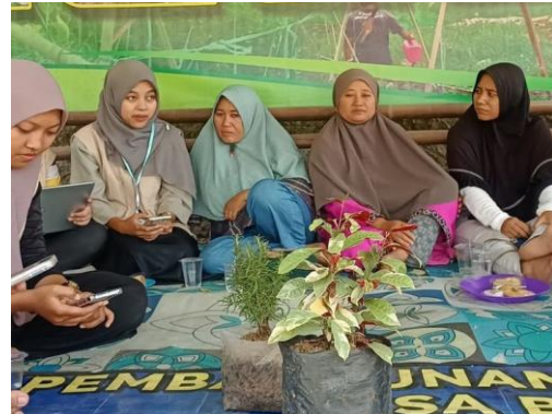
Gambar 2. Pelaksanaan pre-test