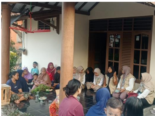
Gambar 3. Sosialisasi infused water

Di era sekarang ini muncul alternatif minuman yang berasa dan sehat selain dari jus buah yaitu infused water . Minuman Infused water merupakan air putih yang ditambahkan dengan potongan buah-buahan atau herbal seperti jahe, kunyit, sereh, kayu manis dan lain sebagainya. sehingga dapat memberikan sensasi rasa tertentu dan dapat bermanfaat bagi kesehatan tubuh (Rusli et al., 2023).