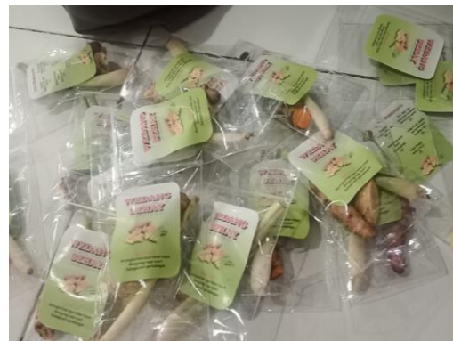
Gambar 4. Produk infused water

Kegiatan sosialisasi manfaat infused water dan pelatihan cara membuatnya dilaksanakan di rumah salah satu anggota KWT bertempat di RT 01 RW 01 (Gambar 3). Kegiatan sosialisasi ini telah dilaksanakan pada hari Sabtu tanggal 19 Agustus pada pukul 15.00 WIB sampai selesai. Sosialisasi ini diikuti oleh kurang lebih 10 orang. Dengan adanya pembuatan infused water , warga dapat lebih mengurangi penggunaan obat kimia dan beralih dengan penggunaan infused water untuk mencegah atau meringankan berbagai