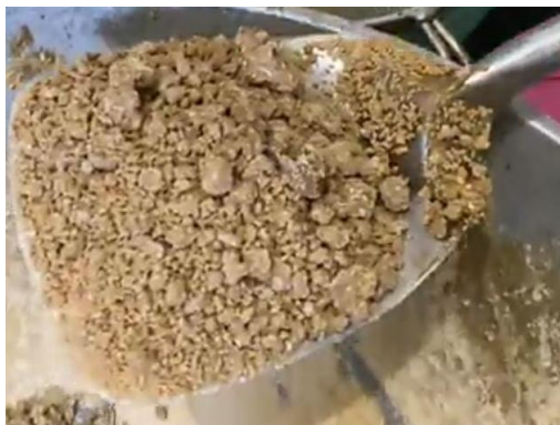
Gambar 5. Pembuatan granul instan

Kegiatan sosialisasi dilaksanakan di Balai Desa Bode Lor Kecamatan Plumbon Kabupaten Cirebon. Materi yang disampaikan adalah mengenai manfaat jahe emprit dan kapulaga, cara pembuatan granul instan, dan produk granul instan (Gambar 5). Tahap pertama pembuatan yaitu jahe dan kapulaga disortasi, jahe emprit dikupas lalu dicuci dengan air bersih setelah itu jahe dipotong tipis-tipis kemudian beri air dan di blender bersama kapulaga. Jika tidak ada blender maka jahe bisa juga di parut dan kapulaga ditumbuk hingga halus, kemudian dipanaskan dengan api sedang sampai mendidih kemudian ditambahkan gula pasir dan diaduk terus sampai campuran mulai mengental lalu api dikecilkan sambil terus diaduk, lalu diayak sampai terbentuk ukuran yang seragam (Syarifah et al., 2020). Granul jahe instan yang sudah jadi lalu dimasukkan ke dalam kemasan dan diberi label cara penggunaannya (Gambar 6).