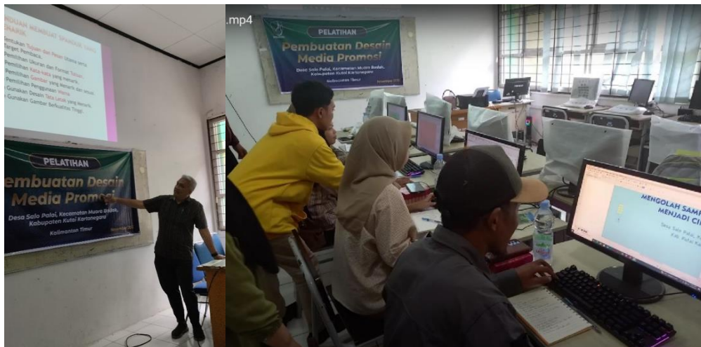
Gambar 1. Pelatihan pembuatan desain media promosi di Desa Salo Palai

Dalam pelatihan pembuatan desain media promosi, sebelum praktik membuat desain media promosi dengan menggunakan aplikasi Corel Draw, maka diberikan materi tentang pentingnya desain media promosi. Penjelasan dimulai dengan bagaimana media promosi itu penting bagi penjualan dan setelahnya dijelaskan tentang penggunaan visual desain seperti bentuk, gaya desain serta penggunaan warna yang bagus untuk media promosi ( Gambar 1 ). Adapun salah satu hasil pelatihan desain disajikan pada Gambar 2 .