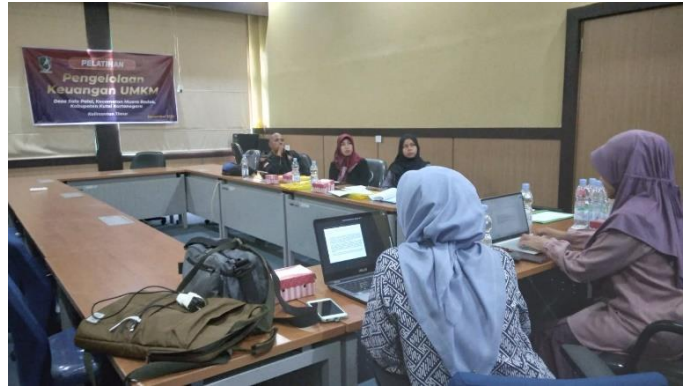
Gambar 3. Pelatihan pengelolaan laporan keuangan