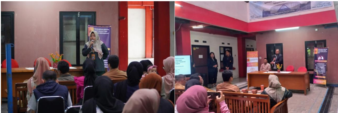
Gambar 2. Kegiatan penyuluhan kepada penghuni apartemen transit

Penghuni apartemen juga belum mengetahui secara menyeluruh mengenai metode digital marketing yang tepat dan cocok untuk pengembangan usaha mereka. Pemilihan media yang tepat dan sesuai dengan perkembangan teknologi, dan juga sesuai dengan kecenderungan perilaku konsumen dalam menggunakan media online , dengan sendirinya dapat membantu memberikan opini yang dapat menjadi pertimbangan bagi calon konsumen untuk melakukan pembelian (Nadya, 2016). Dalam kegiatan PPM integratif KKN ini, peserta menyimak dan bersama-sama belajar memahami penerapan digital marketing sebagai strategi pemasaran yang baik