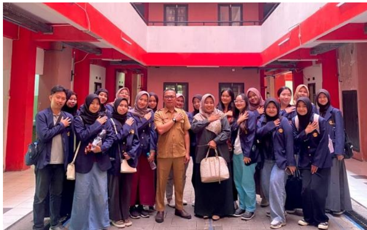
Gambar 1. Kegiatan survei ke apartemen transit dan berdiskusi dengan pengelola apartemen bersama dengan tim mahasiswa KKN UNPAD

Pelaksanaan program pengabdian masyarakat (PPM) ini dilaksanakan terintegratif dengan program KKN mahasiswa semester ganjil tahun ajaran 2023/2024 Universitas Padjadjaran, sehingga kegiatan PPM integratif KKN ini dilakukan secara terukur dan terjadwal. Kegiatan PPM ini yang telah diselenggarakan pada tanggal 29 Januari 2024 secara luring dengan jumlah peserta sekitar 20 orang peserta yang merupakan ibu rumah tangga yang memiliki usaha UMKM dan bertempat tinggal di Apartemen Transit Batujajar dan Desa Batujajar Barat, Kabupaten Bandung Barat. Target capaian hasil PPM integratif KKN bagi masyarakat adalah untuk peningkatan ilmu, pengetahuan mengenai pentingnya promosi dan pemasaran yang tepat melalui digital marketing .