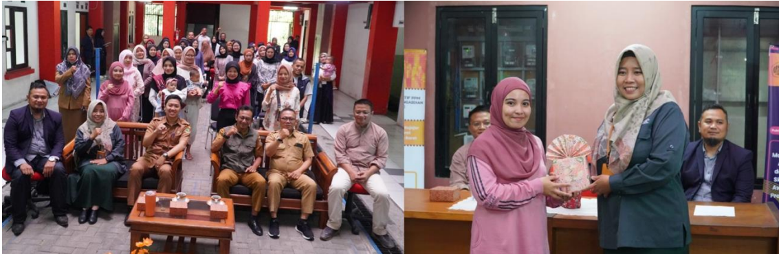
Gambar 3. Foto bersama peserta dan penyerahan doorprize kepada peserta teraktif

narasumber. Setelah menyimak materi penyuluhan, acara kemudian dilanjutkan tanya jawab mengenai digital marketing dan peserta teraktif mendapatkan doorprize dari kegiatan ini (Gambar 3).