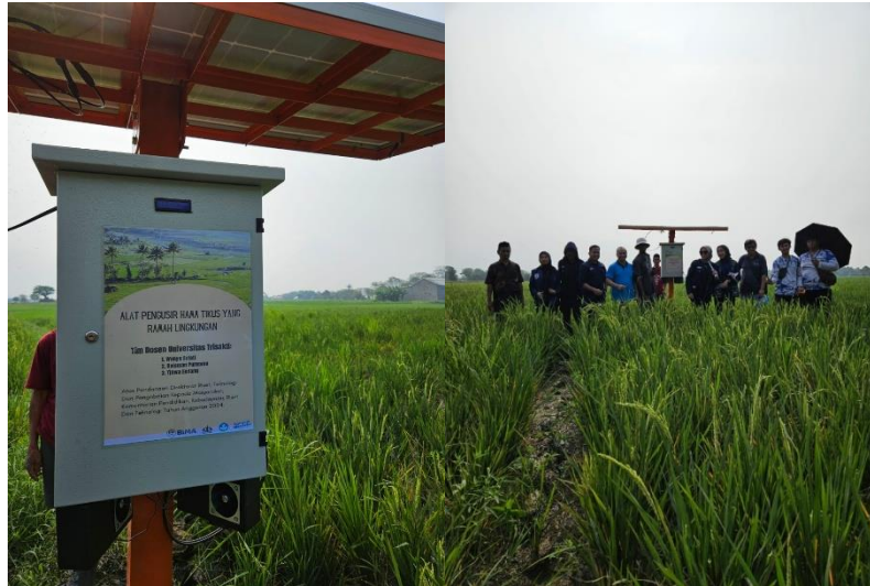
Gambar 3. Alat pengusir hama

Adapun spesifikasi alat pengusir hama tikus seperti jangkauan area efektif 1 ha (10.000 m 2 ), daya yang diperlukan 50 Watt, dimensi (bagian utama): 100 cm x 40 cm x 40 cm, solar panel monokristal 200 W, solar charge controller: MPPT 30A, baterai 12V 50Ah, dan modul pemancar ultrasonik 30W ( programmable ). Dengan spesifikasi tersebut, dihasilkan beberapa keunggulan, diantaranya adalah