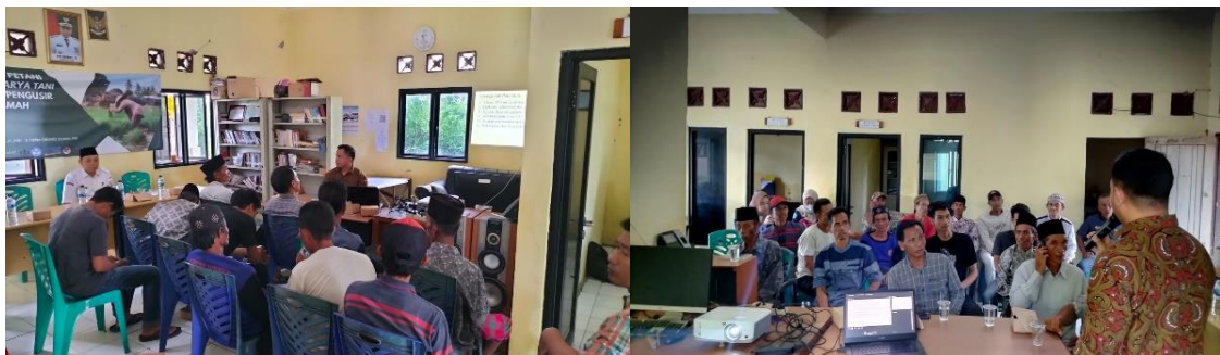
Gambar 2. Kegiatan sosialisasi dan sesi tanya jawab dengan peserta

Pelaksanaan kegiatan diawali dengan sosialisasi kepada kelompok karya tani guna memberitahu bahwasanya akan diadakan kegiatan pengabdian berupa sekolah petani tentang bagaimana cara kerja alat pengusir hama tikus yang ramah lingkungan, seperti yang terlihat pada Gambar 2. Kemudian dilanjutkan dengan sesi tanya jawab dengan para tani, dalam sesi ini para tani menggunakannya untuk tanya jawab terkait bagaimana cara alat pengusir hama tikus yang ramah lingkungan bekerja. Kegiatan sosialisasi ini membuat para tani memperoleh pengetahuan bahwasanya semakin zaman berkembang ada metode lain dalam mengusir hama tikus selain dengan cara metode tradisional dan alatnya pun terbuat dari bahan yang ramah lingkungan sehingga tidak berdampak buruk untuk lingkungan pula.