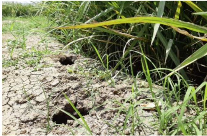
Gambar 1. Lubang tikus pada area persawahan

mulai musim tanam hingga 3 bulan terakhir ketika para petani mau panen (Kalundra, 2021). Serangan hama tersebut membuat para petani menjadi resah, karena hama tikus tidak hanya menyerang tanaman padi yang sudah mulai berbuah saja (Martin, 2022). Tikus umumnya aktif menyerang pada malam hari dan bersembunyi di siang hari (Gambar 1). Di Kelurahan Bendung, Kecamatan Bendung, keberadaan tikus sangat banyak, menyebabkan kerugian signifikan bagi petani padi. Pengendalian hama tikus dilakukan sejak awal hingga menjelang panen, dengan pestisida digunakan jika serangan sudah sangat mengkhawatirkan. Dengan mengurangi jumlah hama tikus, maka produksi hasil pertanian semakin meningkat sehingga diharapkan penjualan hasil tani semakin meningkat.