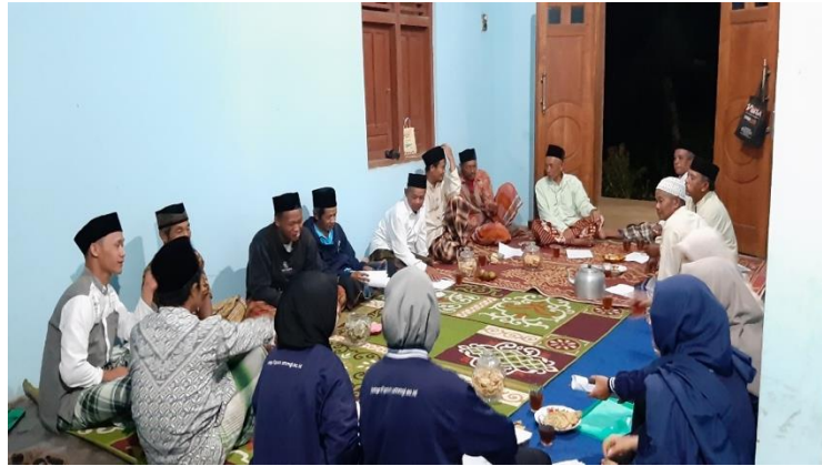
Gambar 1. Sosialisasi Zakat Hasil Pertanian pada Kegiatan Yasinan Bapak-bapak

Kedua , oleh karena terjadi pandemi Covid-19 yang tidak diduga sebelumnya, tim berusaha membuat inovasi agar kegiatan tetap berjalan dan masyarakat memperoleh manfaat. Inovasi tersebut adalah dengan pembuatan video edukatif dan poster tentang zakat hasil pertanian. Video edukatif didistribusikan melalui pesan whatsapp kepada masyarakat dan ditayangkan pada setelah kegiatan yasinan. Kemudian untuk Poster dipasang di papan pengumuman Masjid dan kantor balai desa Kebondalem. Desain poster dapat dilihat pada Gambar 2 .