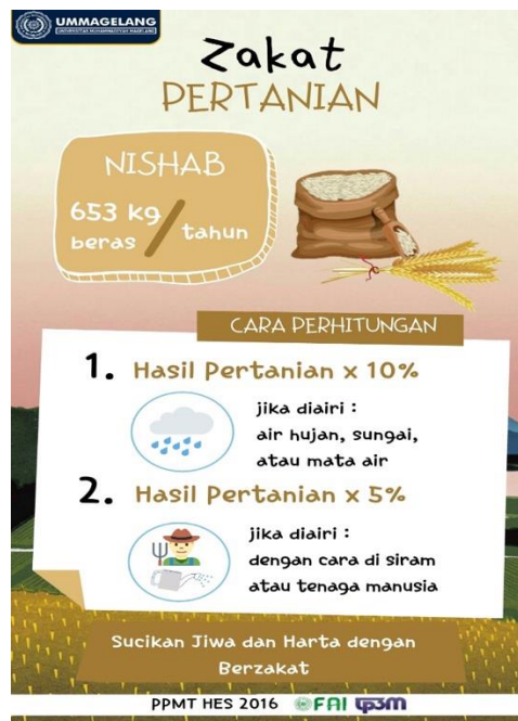
Gambar 2. Poster Zakat Hasil Pertanian

Kedua , oleh karena terjadi pandemi Covid-19 yang tidak diduga sebelumnya, tim berusaha membuat inovasi agar kegiatan tetap berjalan dan masyarakat memperoleh manfaat. Inovasi tersebut adalah dengan pembuatan video edukatif dan poster tentang zakat hasil pertanian. Video edukatif didistribusikan melalui pesan whatsapp kepada masyarakat dan ditayangkan pada setelah kegiatan yasinan. Kemudian untuk Poster dipasang di papan pengumuman Masjid dan kantor balai desa Kebondalem. Desain poster dapat dilihat pada Gambar 2 .