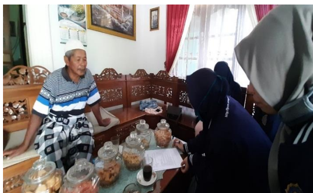
Gambar 3. Pengukuran Pemahaman Masyarakat

Keempat , aktivitas terakhir yang dilakukan adalah pengukuran pemahaman masyarakat tentang zakat hasil pertanian. Tim membuat kuesioner yang terdiri dari 10 pertanyaan untuk dijawab oleh masyarakat. Penyebaran kuesioner dilakukan dengan cara mendatangi setiap rumah warga. Aktivitas penyebaran kuesioner dapat dilihat pada Gambar 3 berikut.