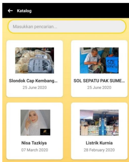
Gambar 4. Katalog Digital pada Aplikasi MitraMu