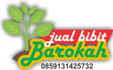
Gambar 2. Hasil Desain Logo UMKM