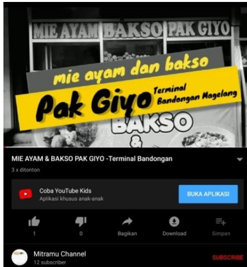
Gambar 3. Video UMKM di Media Sosial YouTube