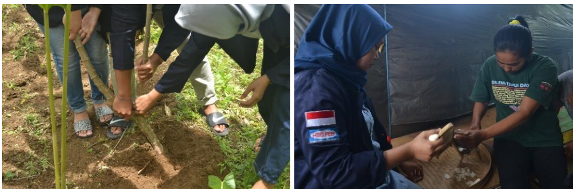
Gambar 2. Pencabutan singkong dan pengolahan

Pengolahan singkong menjadi keripik ini dilakukan oleh ibu-ibu KWT di dusun Duren, mulai dari mencabut singkong dari kebun hingga menjadi keripik dengan berbagai rasa seperti balado, jagung manis, pedas asin, dan barbeque . Kegiatan ini dilakukan agar singkong memiliki nilai lebih dan bisa menambah pendapatan bagi masyarakat Dusun Duren, sebagaimana ditunjukkan pada Gambar 2.