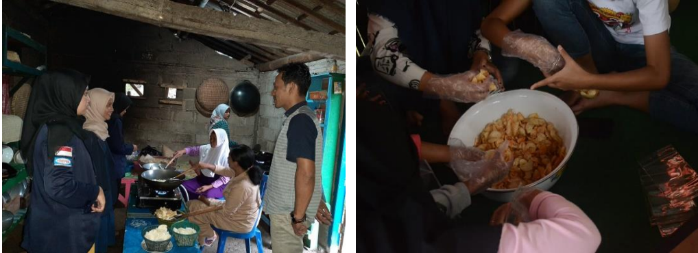
Gambar 3. Proses penggorengan dan pengemasan

Pengemasan dan pemasaran ini dilakukan oleh pemuda dusun Duren setelah kegiatan penggorengan keripik ketela. Mulai dari pelabelan hingga pembuatan media sebagai alat penjualan online untuk menarik pembeli, sebagaimana ditunjukkan pada Gambar 3 . Kegiatan ini dilakukan agar pemasaran bisa dijangkau oleh masyarakat luas bahkan bisa sampai di luar kota.