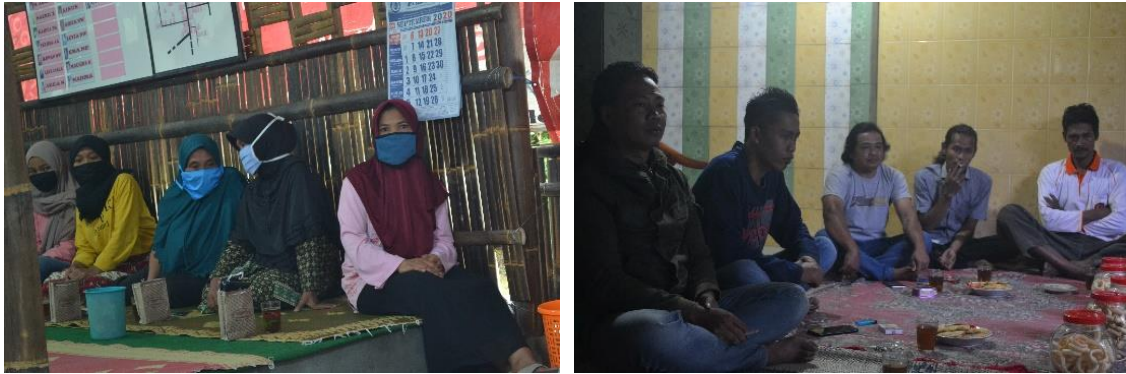
Gambar 1. Sosialisasi kepada masyarakat

Kegiatan pelatihan ini dilaksanakan dari tanggal 25 September 2020-18 Oktober 2020 bertempat di rumah Bapak Kadus Duren. Pelatihan ini dilaksanakan setiap hari Minggu pukul 13.30 - 17.00 WIB yang diikuti oleh ibu-ibu Kelompok Wanita Tani (KWT) untuk proses produksi atau pembuatan, sedangkan untuk pengemasan dan pemasaran diikuti oleh pemuda Dusun Duren. Pelatihan ini bertujuan untuk meningkatkan kesejahteraan para petani dan menciptakan lapangan pekerjaan baru, terutama bagi kaum perempuan dan remaja yang belum mendapatkan pekerjaan tetap. Pelatihan ini dilakukan dengan cara mengolah singkong menjadi kripik yang mempunyai banyak varian rasa agar nilai jual singkong akan bertambah, sehingga nantinya masyarakat Dusun Duren mampu menciptakan Kelompok Usaha Bersama (KUB).