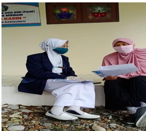
Gambar 1. Pembagian kuesioner pre-test

Selama kegiatan ini berlangsung diwajibkan menggunakan masker dan sebisa mungkin tetap jaga jarak. Penyuluhan diberikan kepada masing-masing peserta dan mengambil tempat yang berjarak dari kegiatan posyandu untuk menghindari terjadinya kerumunan. Hal ini dikarenakan tempat pelaksanaan posyandu yang tidak begitu luas sedangkan banyak ibu dan balita yang datang ke posyandu. Kegiatan dimulai dengan pembagian kuesioner pre-test seperti terlihat pada Gambar 1 . Setelah pengisian selesai maka dilanjutkan dengan pemberian penyuluhan menggunakan media leaflet seperti terlihat pada Gambar 2 .