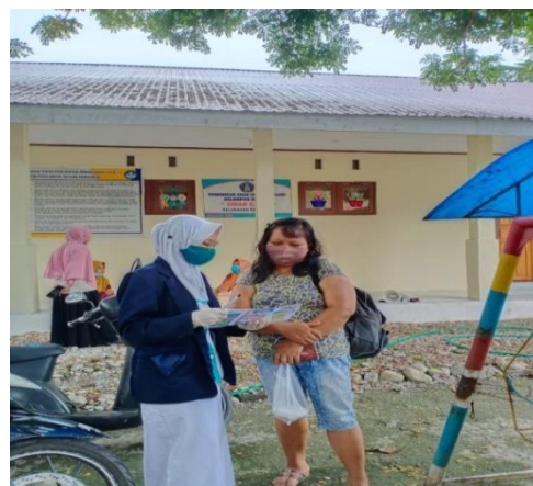
Gambar 2. Penyuluhan menggunakan media leaflet