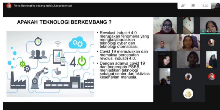
Gambar 1. Pemberian materi pembuka

Memberikan pemaparan tentang sejarah perkembangan teknologi yang ada saat ini, sebagaimana ditunjukkan pada Gambar 1 .