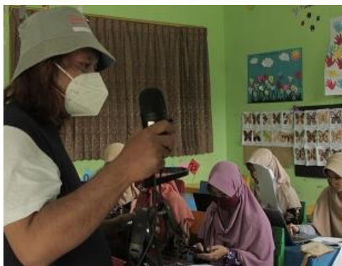
Gambar 1. Workshop pengenalan podcast berbasis Anchor.fm

Workshop ini dilakukan dengan model training for trainer kepada para guru di SD Muhammadiyah Al-Mujahidin Wonosari. Tujuannya, setelah mengikuti workshop para peserta bisa menularkan ilmunya kepada guru-guru yang lain, baik dari lingkungan internal sekolah maupun dari sekolah-sekolah yang lain di Gunungkidul. Workshop dilaksanakan pada Sabtu, 6 Februari 2021 bertempat di SD Muhammadiyah Al-Mujahidin Wonosari. Workshop dimulai tepat waktu yaitu jam 09.00 WIB sampai dengan jam 11.00 WIB ditunjukkan pada Gambar 1 .