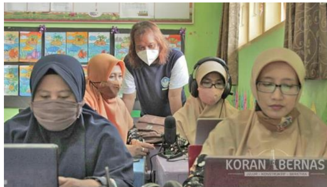
Gambar 2. Praktek produksi podcast yang menjadi berita di koranbernas.id

Setelah mengikuti proses workshop , para peserta langsung diajak melakukan praktik pembuatan podcast materi pembelajaran yang ditunjukkan pada Gambar 2 . Para guru langsung memiliki akun podcast yang akan terus dimanfaatkan untuk kegiatan pembelajaran di sekolah. Sebagai bentuk dukungan kepada SD Muhammadiyah Al-Mujahidin Wonosari dalam mengembangkan podcast edukasi, tim pengabdian UMY memberikan bantuan dua perangkat produksi podcast kepada sekolah sebagai bagian dari skema pengabdian Persyarikatan Muhammadiyah yang menjadi program Catur Darma Perguruan Tinggi UMY. Alat produksi yang disumbangkan diharapkan dimanfaatkan untuk produksi podcast materi pembelajaran yang diunggah di podcast sekolah maupun para guru. Alat produksi podcast berupa mikrofon langsung digunakan untuk produksi podcast.