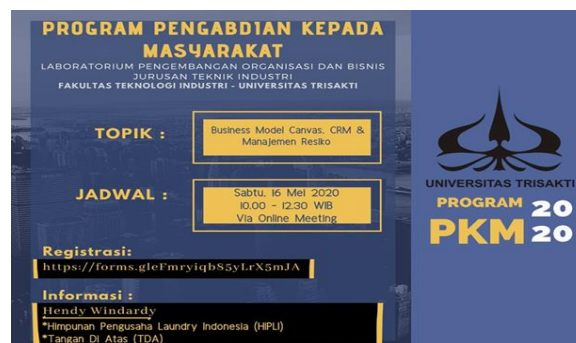
Gambar 1. Poster Kegiatan Pengabdian

Pada tahap persiapan pengabdian diawali dengan diskusi dengan pihak HIPLI, dalam hal diwakili Bapak Hendy selaku wakil ketua HIPLI Cabang Jakarta pada tanggal 4 dan 6 Mei 2020. Hasil dari diskusi adalah penetapan tema yang disepakati dan membuat poster PKM untuk anggota HIPLI (Gambar 1).