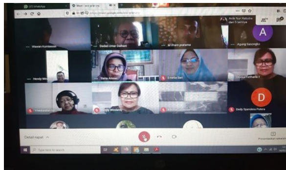
Gambar 2. Kegiatan pelatihan melalui Google Meet

Selanjutnya peserta dibimbing untuk membuat strategi bisnis melalui Lean Canvas. Gambar 3 adalah salah satu contoh strategi bisnis UKM Laundry menggunakan Lean Canvas.