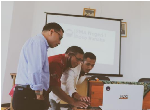
Gambar 3. Launching website sekolah SMA Negeri 1 Poco Ranaka

Setelah semua konten berhasil diunggah, website dapat dikatakan siap untuk diluncurkan. Peluncuran website dilaksanakan pada tanggal 18 September 2021 di SMAN 1 Poco Ranaka yang dilaksanakan oleh Tim Pengabdian Kepada Masyarakat dan kembali diikuti oleh Kepala Sekolah, guru dan tenaga kependidikan, serta beberapa anggota OSIS. Suasana launching website sekolah dapat dilihat pada Gambar 3.