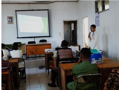
Gambar 1. Pelaksanaan sosialisasi

Sosialisasi yang diberikan berhasil meningkatkan kesadaran mitra akan pentingnya memiliki website sekolah. Para guru dan kepala sekolah terlihat sangat antusias ketika tim menjelaskan manfaat website sekolah sebagai media promosi keunggulan dan prestasi yang dimiliki sekolah yang belum diketahui masyarakat luas. Mereka dengan penuh semangat menyampaikan prestasi-prestasi yang telah diraih oleh para siswa, baik tingkat lokal maupun nasional. Selain itu para guru juga aktif memberikan pertanyaan terkait materi sosialisasi yang disampaikan oleh tim PKM.