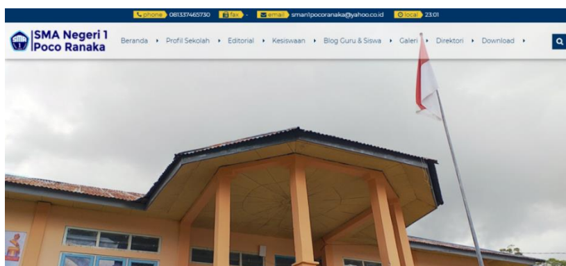
Gambar 2. Tampilan website sekolah SMA Negeri 1 Poco Ranaka

Hasil kegiatan ini dapat dilihat dari tampilan website sekolah SMAN 1 Poco Ranaka yang ditunjukkan pada Gambar 2 di bawah ini. Adapun alamat URL website yaitu https://sman1pocoranaka.sch.id .