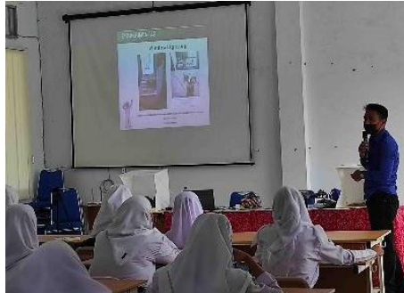
Gambar 3. Penjelasan tentang konsep dasar pencahayaan alami

Selanjutnya disampaikan juga materi pencahayaan alami ( natural lighting ). Setelah pembekalan materi secara teori, kemudian dilakukan praktik pengambilan oleh peserta didampingi oleh dosen-dosen dari DKV. Penjelasan tentang konsep dasar pencahayaan alami dilakukan oleh salah seorang dosen DKV UCIC seperti tertera pada Gambar 3 .