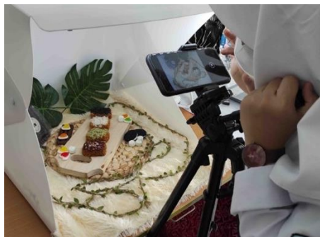
Gambar 2. Siswa praktik langsung memotret produk makanan

Dalam latihan dasar fotografi, siswi SMK Negeri 2 Kota Cirebon diarahkan untuk melakukan latihan fotografi langsung menggunakan smartphone masing-masing. Latihan dasar fotografi yang dilakukan salah satu siswi dari SMK Negeri 2 seperti tertera pada Gambar 2 .