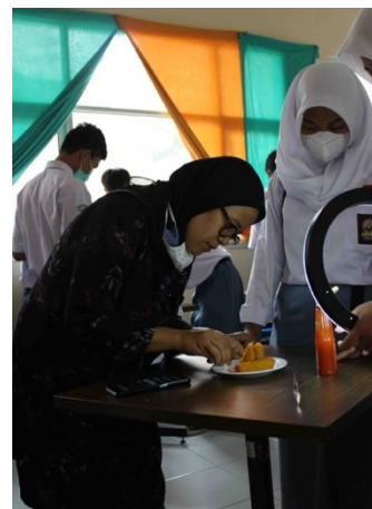
Gambar 5. Pendampingan ke siswa untuk mengatur tata letak produk