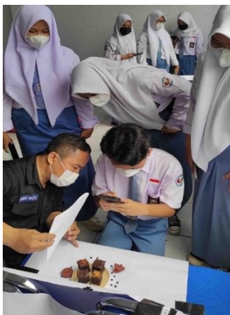
Gambar 4. Siswa dipandu untuk memotret

Kegiatan ini menjadi awal bagi siswa-siswi di SMK Negeri 2 Kota Cirebon untuk terus mempraktikkan fotografi secara independen. Dengan dukungan dosen-dosen DKV dari UCIC pelaksanaan kegiatan ini dapat berjalan lancar karena penguasaan materi dasar-dasar fotografi oleh pengajar. Faktor penghambat kegiatan adalah spesifikasi smartphone yang berbeda-beda dari semua peserta sehingga pendampingan dan teknik pencahayaan yang diajarkan berbeda juga pada saat praktik langsung.