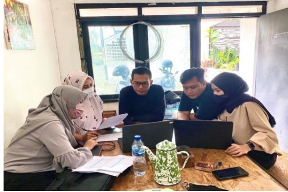
Gambar 1. Kegiatan sosialisasi penyusunan laporan keuangan