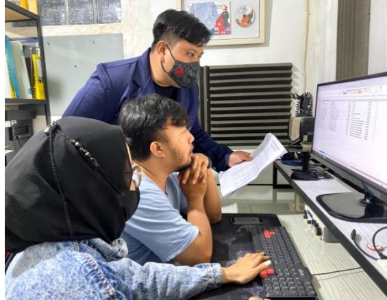
Gambar 3 . Kegiatan pendampingan penyusunan laporan keuangan

Kegiatan pendampingan dilakukan dengan cara mendampingi usaha jasa foto dan video “Bluesummer” dalam pembuatan laporan keuangan. Selain itu, pada saat pendampingan, pemahaman SDM terhadap laporan keuangan dievaluasi. Tim PPMT melakukan pendampingan mengenai laporan keuangan dengan cara mendampingi dan mengevaluasi mitra pada saat mitra menyusun laporan keuangan yang terdiri dari laporan laba rugi tahun 2021 dan laporan posisi keuangan tahun 2021 ( Gambar 3 ).