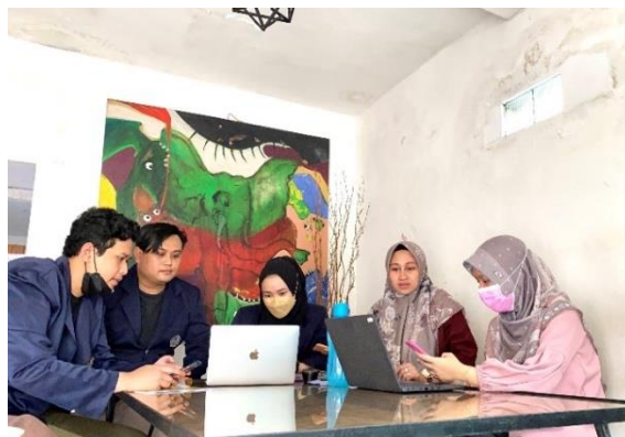
Gambar 2. Kegiatan penyusunan laporan keuangan

Setelah itu, transaksi dicatat ke dalam jurnal. Jurnal tersebut diposting ke dalam buku besar. Setelah selesai posting ke dalam buku besar, tim PPMT melatih mitra untuk menyusun neraca saldo. Langkah selanjutnya yaitu menyusun jurnal penyesuaian dan neraca saldo penyesuaian yang dilanjutkan dengan menyusun neraca lajur. Setelah itu, tim PPMT melatih mitra untuk menyusun laporan keuangan yang terdiri dari laporan laba rugi Tahun 2021 dan laporan posisi keuangan Tahun 2021. Laporan laba rugi menyajikan informasi kinerja keuangan entitas yang terdiri dari informasi mengenai penghasilan dan beban selama periode pelaporan. Laporan posisi keuangan menyajikan informasi posisi keuangan entitas yang terdiri dari informasi mengenai aset, liabilitas, dan ekuitas entitas pada tanggal tertentu.