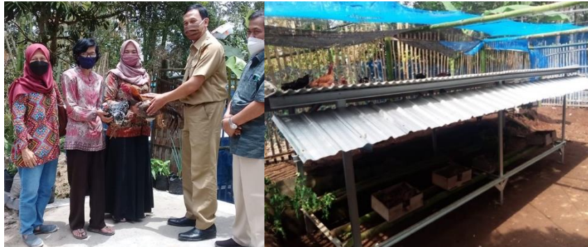
Gambar 3. Penyerahan bantuan ayam kampung dan demplot babonisasi

Model babonisasi berkelompok sebelum kegiatan PPM ini belum ada, setelah ada kegiatan PPM terdapat satu unit kandang semi intensif untuk penambahan pendapatan anggota. Berdasarkan evaluasi, model babonisasi berkelompok sangat menguntungkan karena dari 20 ekor indukan, 90% sudah bertelur dengan jumlah anakan sebanyak 60 ekor umur 2 bulanan, dan kuri (kutuk umur sehari=doc) sebanyak 100 ekor.