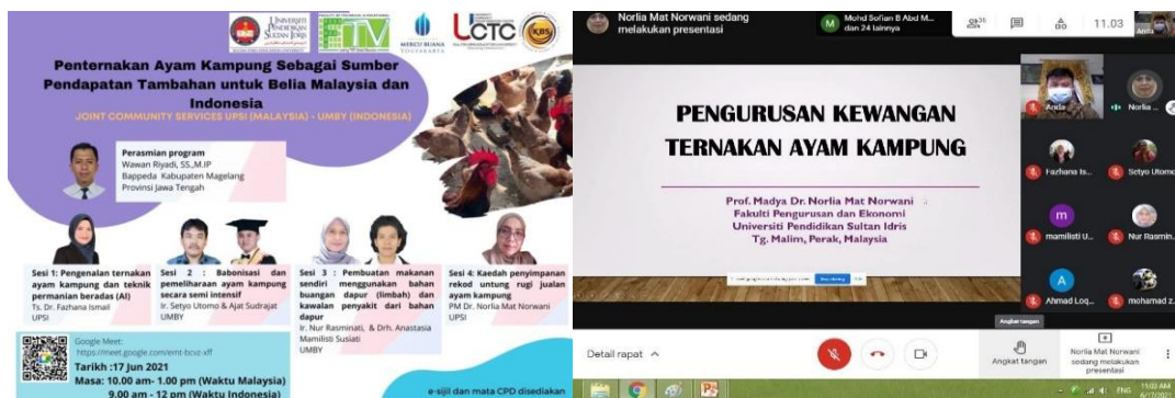
Gambar 1. Poster dan suasana pelatihan Zoom Meeting

Antusiasme peserta ditunjukkan dengan banyaknya pertanyaan selama acara pelatihan daring dilaksanakan baik yang berkaitan dengan sistem babonisasi, pemeliharaan ayam semi intensif, pembuatan pakan ayam kampung berbasis bahan lokal, Inseminasi Buatan (AI) pada ayam dan efisiensi usaha berdasarkan perhitungan untung rugi dalam pemeliharaan ayam kampung serta upaya-pencegahan penyakitnya ( Gambar 1 ).