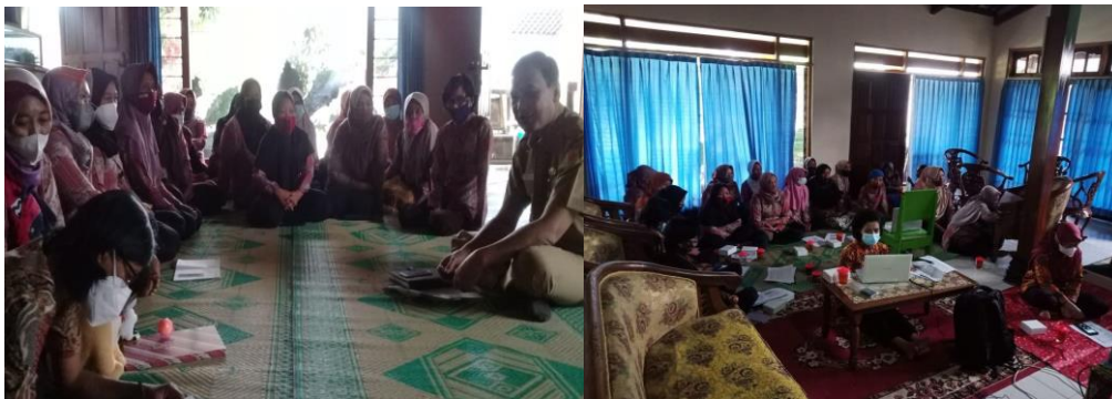
Gambar 2 . Dokumentasi kegiatan pelatihan

Pada pelaksanaan PPM Desa Banyusidi, telah terdistribusi indukan ayam kampung sebanyak 20 ekor di KWT Larasati (yang terdistribusi untuk 10 anggota) dan dipelihara secara bersama-sama dalam kandang kelompok yang sudah dibangun bersama. Harapannya pada tahun berikutnya akan ada 10 anggota baru yang menerima guliran babon (indukan). Sehingga pada tahun ketiga, semua anggota sudah memiliki indukan yang dipelihara secara bersama-sama dalam kandang kelompok dengan sistem piket.