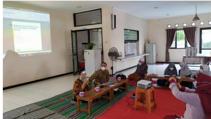
Gambar 2. Pemaparan materi oleh tim pengabdian