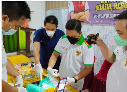
Gambar 3. Proses pendampingan saat melakukan sunat modern super ring

Tahap pendampingan merupakan tahapan dari rencana tindak lanjut dari kegiatan sosialisasi dan pelatihan (Gambar 3). Setiap siswa peserta kegiatan pelatihan diberikan kebebasan untuk mengembangkan dan mengaplikasikan sunat modern super ring dengan bimbingan secara rutin melalui media komunikasi maupun dampingan langsung saat melakukan sunat modern super ring dengan kombinasi bius tanpa jarum suntik.