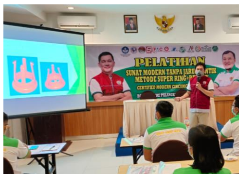
Gambar 1. Penyampaian materi pelatihan

Dalam kegiatan ini pemateri memberikan pretest sebelum materi disampaikan untuk mengetahui sejauh mana pengetahuan atau pemahaman responden terkait materi yang akan disampaikan. Setelah diberikan informasi, pemateri kembali memberikan posttest untuk mengetahui sejauh mana peningkatan pengetahuan atau pemahaman responden terkait materi yang disampaikan. Hasil pretest terkait materi yang disampaikan diperoleh rata-rata nilai 40 dan nilai posttest 74 dari jumlah peserta sebanyak 78 orang, sehingga dapat disimpulkan bahwa terjadi kenaikan pengetahuan atau pemahaman tentang sunat modern super ring kombinasi bius tanpa jarum suntik sebesar 46% pada tahap evaluasi pertama setelah pelatihan. Evaluasi selanjutnya dilakukan selambatnya enam bulan dari setiap kegiatan sekaligus masuk pada tahapan pendampingan.