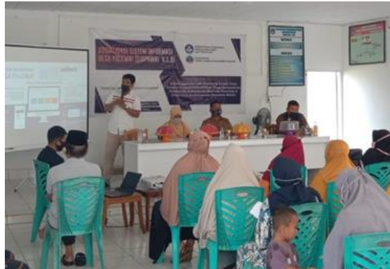
Gambar 2. Penyampaian materi sosialisasi

Kegiatan sosialisasi ini dibuka oleh kepala desa. Dalam sambutannya beliau mengungkapkan rasa syukur atas terciptanya sebuah sistem yang dapat memudahkan pihak pemerintah desa dalam rangka memberikan pelayanan publik kepada warga desa. Setelah sambutan sekaligus pembukaan tersebut, selanjutnya dilakukan sosialisasi tentang sistem informasi desa palewai (SIDPAWAI V1.0) oleh pemateri seperti yang tampak pada Gambar 2 . Materi sosialisasi yang disajikan oleh pemateri lebih bersifat teknis terkait bagaimana mengoperasikan sistem tersebut.