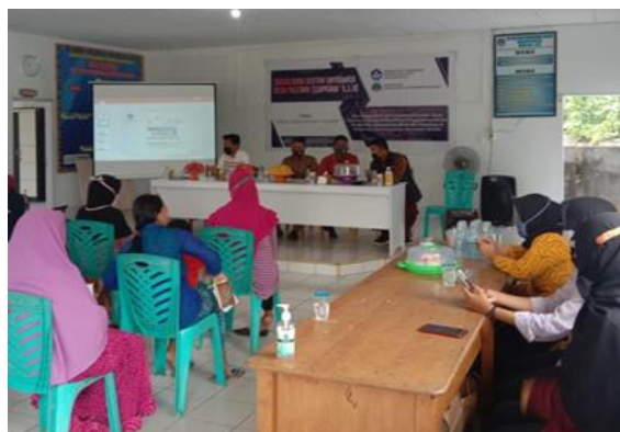
Gambar 3. Tanya jawab antara narasumber dan peserta

Setelah semua materi disampaikan oleh pemateri, maka selanjutnya panitia membagikan kuesioner kepada seluruh peserta guna mengevaluasi pemahaman peserta. Setelah mengisi kuesioner yang telah dibagikan, kegiatan berlanjut ke sesi tanya jawab seperti pada Gambar 3 . Pada sesi ini ada beberapa peserta yang memberikan pertanyaan kepada narasumber terkait dengan hal teknis yang belum dipahami. Bukan hanya warga saja yang memberikan pertanyaan, operator desa juga tidak mau ketinggalan untuk mempertanyakan beberapa hal terkait dengan cara mengoperasikan sistem Sidpawai v1.0 ini.