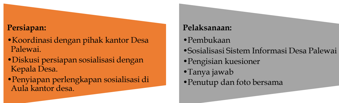
Gambar 1. Tahapan kegiatan

Pelaksanaan sosialisasi merupakan inti dari kegiatan pengabdian kepada masyarakat ini. Sosialisasi dilakukan di Kantor Desa Palewai pada Jum'at, 3 September 2021, Jam 08.00 WITA, dengan dihadiri oleh Kepala dan Sekretaris Desa Palewai, pegawai kantor dan warga desa Palewai, serta tim dosen dan mahasiswa Universitas Sembilanbelas November Kolaka. Jumlah khalayak sasaran yang mengikuti kegiatan sebanyak 52 orang yang merupakan warga Desa Palewai. Kegiatan pengabdian ini dilakukan menggunakan metode sosialisasi dengan detail disajikan pada Gambar 1.