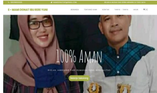
Gambar 2. Tampilan utama aplikasi e-Minat

Setelah mengikuti pelatihan, pelaku usaha sangat senang bahkan berterima kasih dan langsung menggunakan aplikasi tersebut. Dalam wawancaranya, pelaku usaha tidak hanya menjualkan produknya, tetapi juga ingin membantu produk orang lain yang menitipkan di lapaknya untuk bisa dipasarkan, seperti jamu rumahan. Gambar 3 merupakan dokumentasi kegiatan wawancara kepada mitra pengabdian.