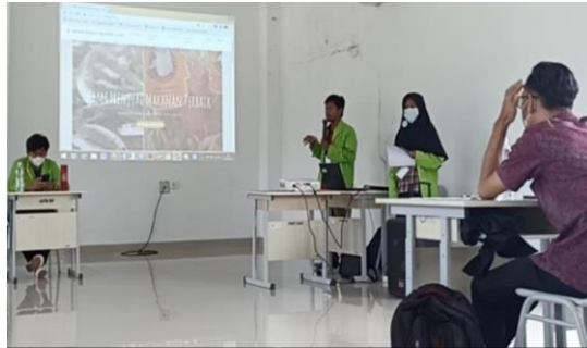
Gambar 1. Sosialisasi penggunaan website

sendiri, hingga konfirmasi pembelian dari konsumen dan review pembeli setelah melakukan pembelian. Gambar 2 merupakan tampilan aplikasi e-Minat.