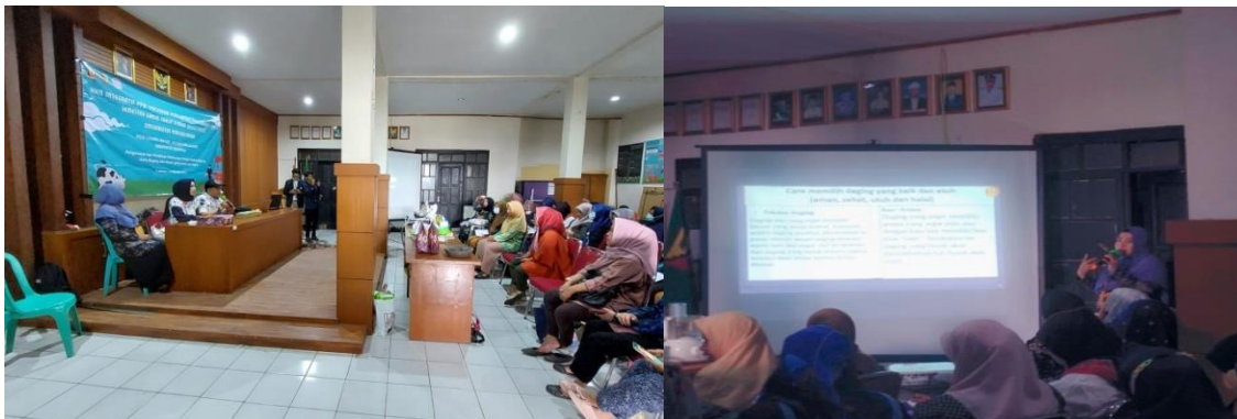
Gambar 2. Kegiatan penyuluhan kepada masyarakat

Program pengabdian penyuluhan dan pelatihan pembuatan pangan olahan daging (abon dan sosis) yang aman dan sehat bagi ibu-ibu tim PKK dan Kader Posyandu Desa Cileunyi Wetan yang dilaksanakan di Balai Desa Cileunyi Wetan, Kecamatan Cileunyi sudah berjalan dengan baik. Kegiatan ini dibuka secara resmi oleh Kepala Desa Cileunyi Wetan dan dilaksanakan sesuai dengan waktu yang dijadwalkan dengan tetap memperhatikan protokol kesehatan yang benar. Dalam hal ini, penyuluhan tetap selalu menjaga jarak, menggunakan hand sanitizer, dan selalu menaati himbauan memakai masker (Gambar 2).