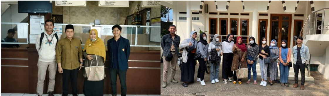
Gambar 1. Dokumentasi survei dan diskusi dengan Kepala Desa