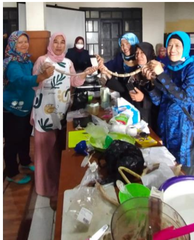
Gambar 3. Kegiatan pelatihan dan praktik pembuatan sosis dan abon

Pada proses pelatihan, peserta antusias untuk mendapatkan ilmu secara langsung dari narasumber yang kompeten di bidangnya. Antusiasme peserta dapat terlihat dari peran aktif peserta dalam kegiatan pelatihan dan juga proses diskusi dan tanya jawab antara peserta dengan para narasumber. Pelatihan ini dilaksanakan dengan membuat dua olahan daging, yaitu abon dan sosis (Gambar 3). Adapun proses pembuatan pangan olahan daging (sosis dan abon) dapat dilihat pada (Gambar 4)