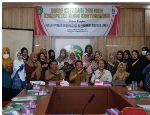
Gambar 2 . Kegiatan sosialisasi pembukaan klinik UMKM

Agenda tersebut diawali dengan pengenalan klinik UMKM yang akan dibangun oleh pemerintah Kecamatan Loa Kulu yang dua hari berikutnya setelah pelatihan itu dilaksanakan akan dibuka secara resmi, sehingga memudahkan para pelaku UMKM bila membutuhkan surat-menyurat ataupun hanya sekedar menitipkan produk olahan mereka di klinik tersebut, kegiatan ini dapat dilihat pada Gambar 2 . Tujuan didirikannya klinik UMKM ini adalah untuk memberikan sarana kepada para pelaku UMKM agar mempermudah pembuatan Nomor Izin Berusaha (NIB), nomor Pangan Industri Rumah Tangga (PIRT) ataupun sekedar menitipkan produk mereka untuk dipajang. Dengan adanya klinik UMKM ini diharapkan dapat memaksimalkan potensi ekonomi kreatif dan pengembangan produk yang dimiliki oleh para pelaku UMKM di Kecamatan Loa Kulu.