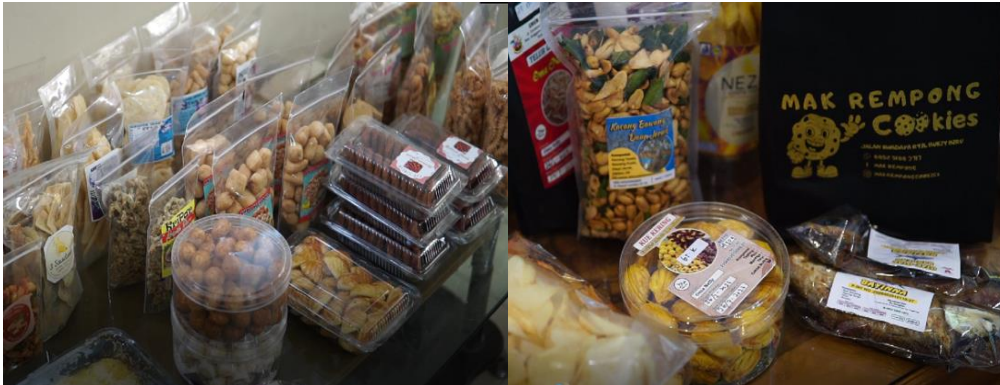
Gambar 1 . Produk UMKM di Kecamatan Loa Kulu

dengan sebuah pelatihan yang di dalamnya terdapat 30 peserta yang berasal dari Kecamatan Loa Kulu yang disajikan pada Gambar 1 . Adapun dalam kegiatan tersebut memiliki beberapa agenda yang disampaikan guna memberikan pengetahuan dan wawasan bagaimana cara promosi untuk menjangkau pasar yang lebih luas, baik itu promosi melalui sosial media maupun e-commerce .