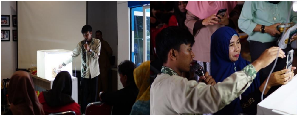
Gambar 3. Kegiatan pelatihan pengambilan gambar produk

Setelah penjelasan mengenai e-commerce selesai, dilanjut dengan pengarahan mengenai cara agar mendapat angle yang pas dan terkesan indah (estetik) yang disajikan pada Gambar 3 . Selanjutnya pengarahan mengenai cara agar mereka mampu melakukan promosi di media sosial. Sosial media yang digunakan dalam melakukan promosi adalah Facebook dan Instagram. Untuk Facebook sendiri mungkin bagi sebagian para pelaku UMKM telah paham dan sebagian juga menggunakan aplikasi sosial media tersebut, akan tetapi belum dapat menggunakannya dengan maksimal. Sehingga dengan adanya pelatihan ini juga bermanfaat dikarenakan disampainya informasi untuk dapat memaksimalkan penggunaan Facebook secara efektif. Setiap penjelasan yang diberikan, para pelaku UMKM ikut aktif dalam mempraktikkan apa yang telah diberikan dan diarahkan dalam penjelasan yang disampaikan.