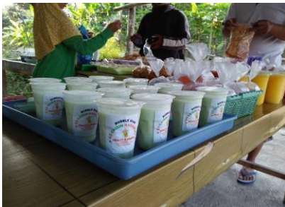
Gambar 3. Pemasaran