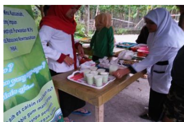
Gambar 4. Pemasaran

Selain itu kami juga belajar dunia baru selain dunia perkuliahan, yakni dunia wirausaha. Dengan memproduksi minuman ini kita dapat membantu masyarakat dalam memenuhi asupan sayur, dan juga dapat membuka peluang usaha bagi para mahasiswa maupun masyarakat untuk berwirausaha. Dalam kegiatan ini kami melakukan proses produksi dan penjualan yang cukup signifikan sebagai pendatang baru dalam inovasi es buble gum. Mulai dari penjualan online hingga penjualan offline. Berikut berbagai kegiatan produksi yang kami lakukan sebanyak 9 kali produksi yaitu :