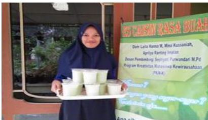
Gambar 2. Hasil Produksi