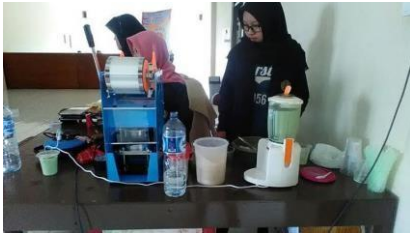
Gambar 1. Kegiatan Produksi