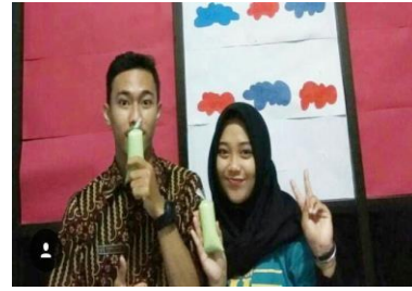
Gambar 5. Pemasaran

es caisin dan menjadi minuman favorit mereka. Sehingga selama 3 bulan kami dapat memproduksi 405 cup dan terjual semuanya, ini membuktikan bahwa Es Caisin Rasa Buah ini menjadi minuman favorit masyarakat. Minuman ini juga cocok untuk para vegetarian, anak-anak yang tidak menyukai sayur, masyarakat yang menginginkan turun berat badannya.